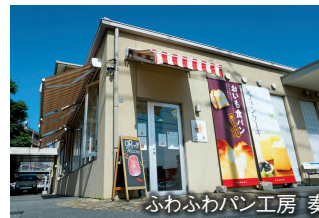
じゃんぷ・ふわふわパン工房 奏