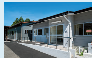
社会福祉法人 昭和会

〒780-0062 高知県高知市新本町2-15-20 TEL.088-803-8600 FAX.088-803-8700