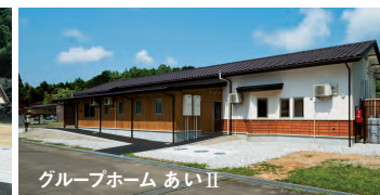
グループホーム あいⅡ