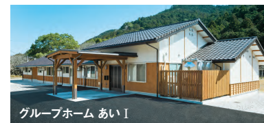
グループホーム あいⅠ